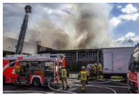
Charlottenburg 100 Feuerwehrmänner bekämpfen Großbrand in Lagerhalle